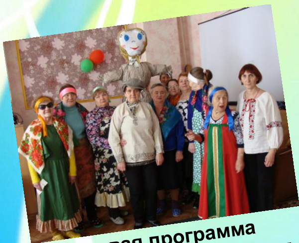
игровая программа «Веселись, честной народ, Масленица идет!»

В наше нелегкое время, когда пожилые граждане очень сильно ограничены в средствах, практически не имеют доступа к объектам культуры и искусства, отделение дневного пребывания для многих пенсионеров является единственным местом, где они могут проявить свои творческие способности, реализовать себя в самодеятельном искусстве, провести интересно свое свободное время, послушать народные песни, пообщаться со своими ровесниками.