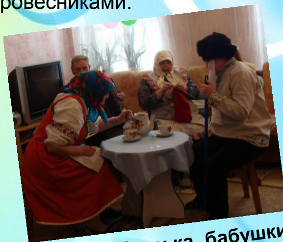
конкурс "А, ну-ка, бабушки!"