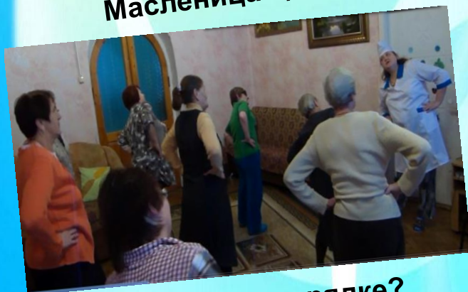
Здоровье в порядке? Пора на зарядку!